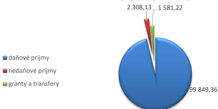
Graf 1 Štruktúra príjmovej časti rozpočtu